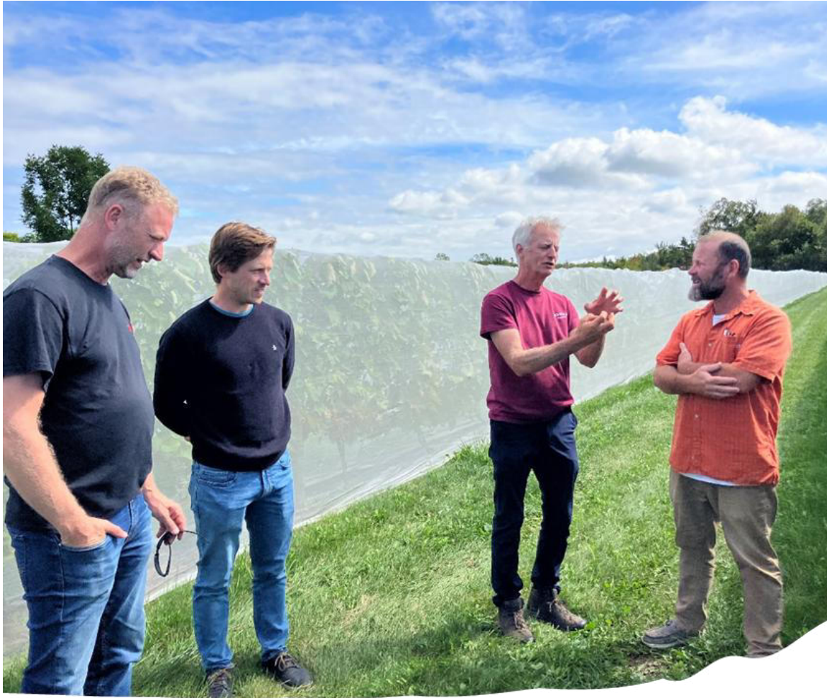
Cohorte vignes : des stratégies partagées.